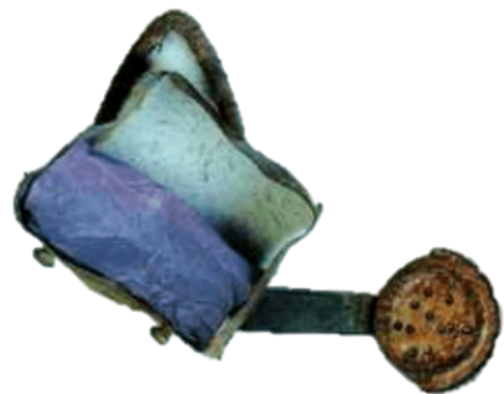
ARROSOIR arrosoir arrosoir