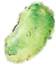
GRAINE graine graine