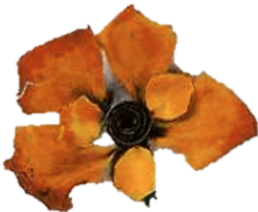
FLEUR fleur fleur